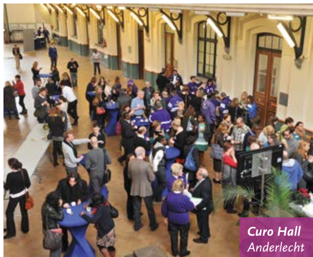
Curo Hall Anderlecht

Tijdens dit colloquium hebben de commissaris-generaal van de federale politie, mevrouw Catherine De Bolle, en talrijke spelers inzake preventie en professionele gelijkheid van gedachten gewisseld over deze kwestie, om hun ervaring en de goede praktijken die ze ontwikkeld hebben bij hun diensten te delen.