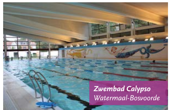
Zwembad Calypso Watermaal-Bosvoorde

In 2014 werd bijna 6,5 miljoen euro uitgetrokken voor 19 infrastructuurprojecten in 12 gemeenten (15 projecten in 8 gemeenten in 2013).