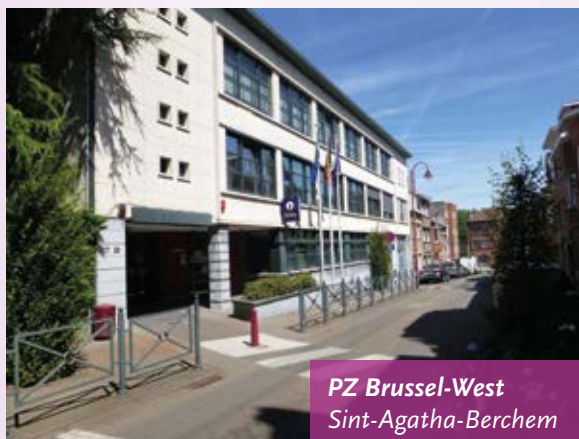
PZ Brussel-West Sint-Agatha-Berchem