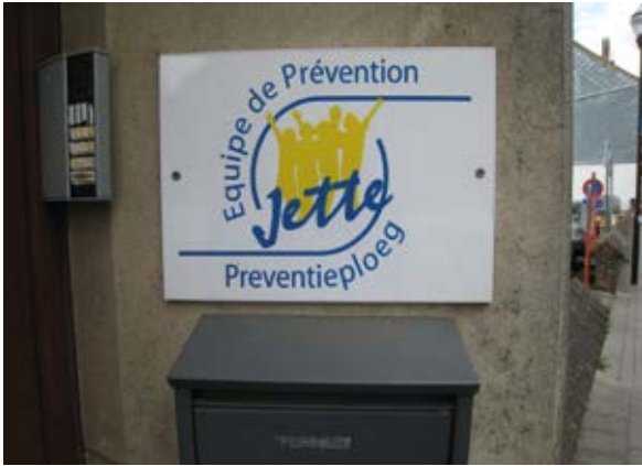
A) Het Brusselse Preventie- en Buurtplan

Brussels Preventie en Buurtplan - toelage 2014