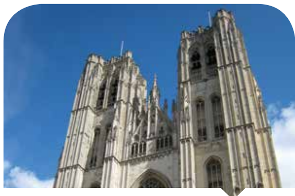
De kathedraal Sint-Michiel en Goedele

Op 1 januari 2002 werd de wetgeving betreffende de organisatie en het toezicht op de erkende godsdienstige gemeenschappen geregionaliseerd. Bepaalde gemeenschappen dekten een geografisch gebied dat de gewestgrenzen overschrijdt. Voor de uitoefening van dit toezicht is een samenwerkingsakkoord tussen de gewesten dus absoluut onontbeerlijk. Het probleem is bijzonder cruciaal voor het aartsbisdom Mechelen-Brussel dat zich niet alleen over ons Gewest uitstrekt, maar ook nog eens over drie provincies. De twee katholieke kathedraalfabrieken die in dit gebied liggen, Sint-Michiels-en-Sint-Goedele in Brussel en Sint-Rombouts in Mechelen, bestrijken a priori de drie gewesten. In 2012 werd nog geen samenwerkingsakkoord ondertekend.