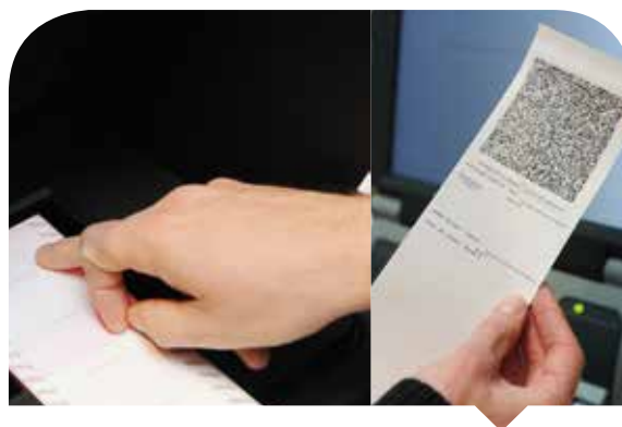
De strook afgedrukt door het systeem Smartmatic

Wat het Smartmatic-systeem betreft, heeft het BPB geen enkel omvangrijk verzoek om interventie genoteerd. Het verslag van het college van gemandateerde experts heeft weliswaar enkele kinderziekten aan het licht gebracht die samenhangen met dit nieuwe systeem, maar benadrukte tegelijk het grote potentieel ervan.