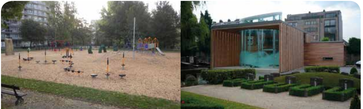
Renovatie van de publieke speelruimte van het Park Peterbos in Anderlecht. Renovatie van het gebouw van het kerkhof van Jette tot een modelgebouw.

Daarnaast werden de niet-gebruikte bedragen van de DID voor de periode 2007-2009, zijnde 1 miljoen euro, overgeheveld naar de periode 2010-2012 en bestemd voor werken rond rationeel energiegebruik in gebouwen.