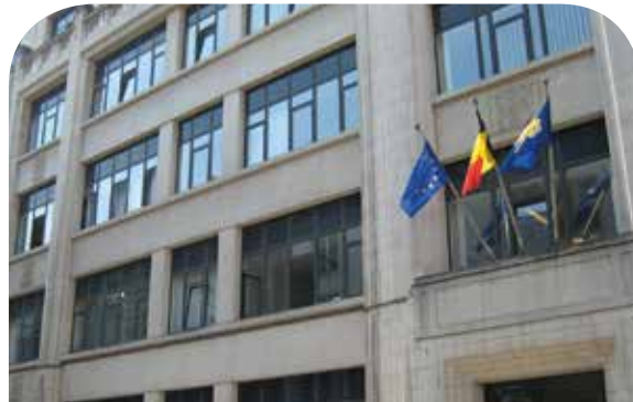
Zetel van de GSOB, Kapitein Crespelstraat te Elsenne

Tot slot vervolledigt een subsidie van 114 000 euro toegekend aan de vzw “Solidarité” de gewestelijke tussenkomst op het vlak van de bestrijding van schoolverzuim. In de praktijk biedt deze vereniging jongeren de kans om deel te nemen aan een jaar van actief burgerschap, en tijdens die periode voeren ze een reeks prestaties uit voor rekening van partnerverenigingen en volgen ze opleidingen inzake actief burgerschap die aan het einde van de rit moeten leiden tot het uitwerken van een zogenaamd “postsolidariteitsproject”.