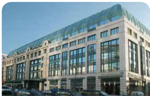
De burelen van het BPB nemen een gedeelte in van het City Center gelegen Kruidtuinlaan.

Adviseren: het beeld van de taak die het BPB uitvoert, is grondig geëvolueerd. De plaatselijke instellingen begeleiden, ontmoeten, en raad geven, dat alles maakt noodzakelijk deel uit van het verrichte werk. Daarnaast wordt ook het adviseren van de Regering over overheidsopdrachten, plaatselijke financiën of bestuur via analyses en adviezen een steeds belangrijker onderdeel van het takenpakket.