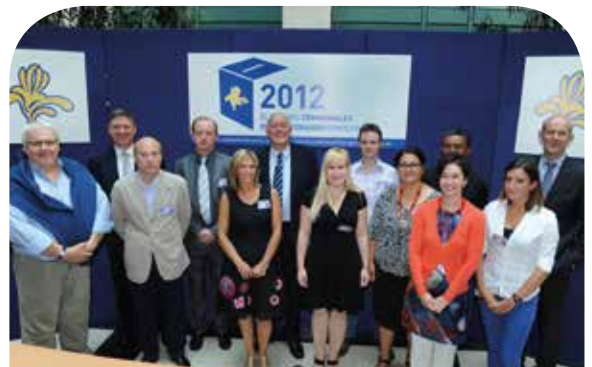
De Minister-President omringd door een deel van de ploeg van het BPB die de verkiezingen organiseerde

Dit werk van alledag, voor velen van vele avonden en enkele nachten en zelfs weekends, heeft het verhoopte resultaat opgeleverd.