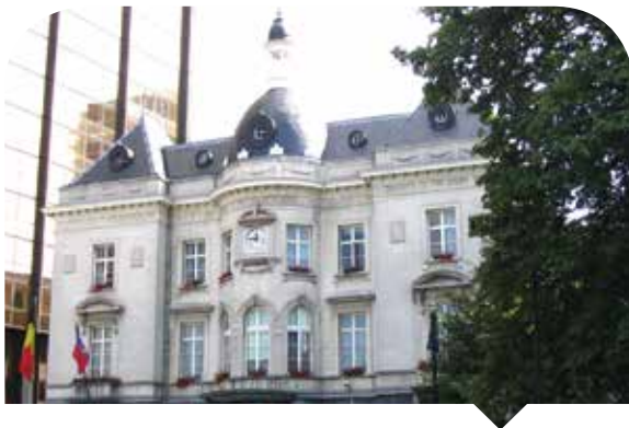
Gemeentehuis van Sint-Joost-Ten-Node

Verscheidende directies van het BPB hebben gevraagd om meerdere bepalingen van de Nieuwe Gemeentewet te wijzigen, hetzij wegens externe redenen (wetswijziging, Europese richtlijnen, uitvoering van het protocolakkoord tussen de vakorganisaties met het oog op de wijziging van het sociale handvest, uitvoering van het regeerakkoord), hetzij op basis van interne initiatieven (technische correcties, kwestie van de afvaardigingen). Er werd een werkgroep opgericht om een lijst op te