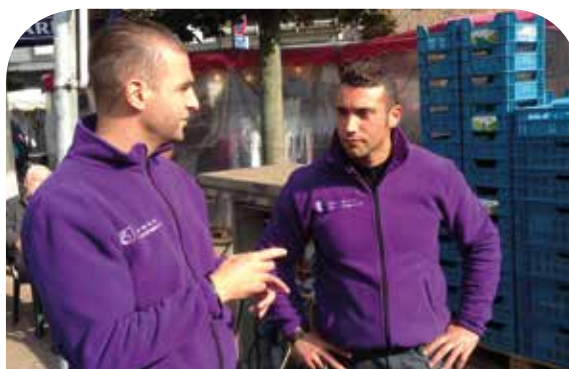
Gemeenschapswachten in de Jetse markt.

Laten we bijvoorbeeld Assetip vermelden (Mission locale d'Etterbeek), die belast is met een vooropleiding "gemeenschapswachten", de vzw "Objectif", in het kader van hoffelijkheidsacties in het openbaar vervoer, de vzw "Transit", centrum voor hulp aan drugsverslaafden of