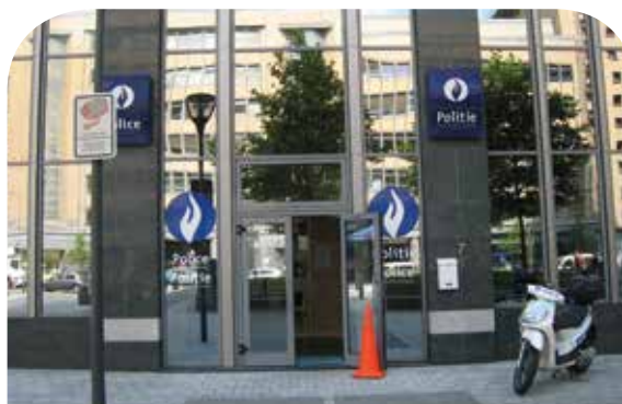
Wijkcommissaris van de Politiezone Zuid