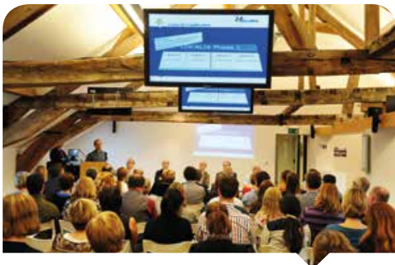
Voorstelling van Localia aan de gemeenten in het BIP, Koningsplein

In tijden van administratieve vereenvoudiging en duurzame ontwikkeling is het Bestuur Plaatselijke Besturen begonnen met de modernisering van zijn informatica-tool om deze doelstellingen te behalen. Op termijn zullen alle documenten die ontvangen en geproduceerd worden door het BPB in elektronisch formaat bestaan. De meeste van deze documenten zullen zelfs nooit in papieren formaat bestaan hebben. Ze zullen vanop afstand toegankelijk zijn door middel van een webtoepassing die specifiek voor dit doel ontworpen werd: het platform TxChange.